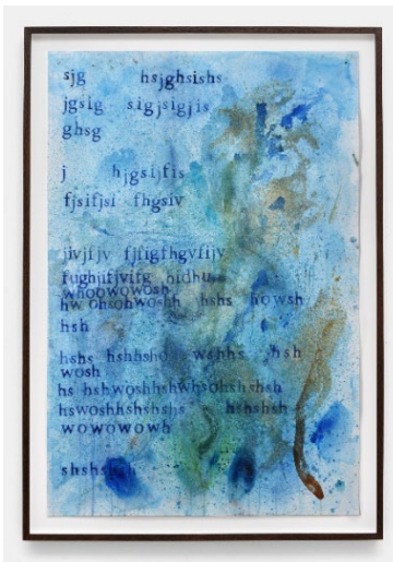
David Horvitz When the Ocean Sounds (Waves) , 2018 Wasserfarbe, Tinte, Meersalz, Meerwasser