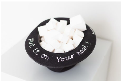
Takako Saito Head Music , 1993 Filz, Acrylfarbe, Papierwürfel Courtesy Takako Saito Foto: Stiftung Museum Schloss Moyland/ Johannes Hüffmeier