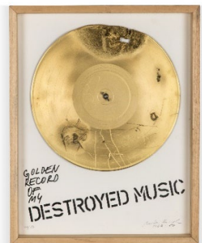
Milan Knížák Golden Record of My Destroyed Music, 1963, 1980 Vinyl, Kleber, Metall, goldener Farbspray, Siebdruck, Pappe, Holzrahmen und Glas © VG Bild-Kunst, Bonn 2023