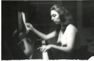
Ute Klophaus Charlotte Moorman spielt Erik Saties „Vexations“ am Klavier, 1966 Schwarzweißfotografie auf Barytpapier © bpk/Stiftung Museum Schloss Moyland/Ute Klophaus/Leihgabe der Ernst von Siemens Kunststiftung