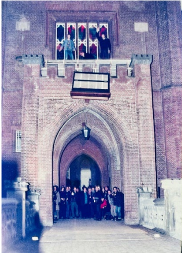
Beck Hansen Yoko Ono Piano Drop, 2000 Museum Schloss Moyland am 12.3.2000