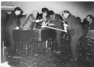
Hartmut Rekort Piano Activities. Fluxus-Internationale Fest-spiele Neuester Musik, 1962 Silbergelatineabzug DOP, Barytpapier